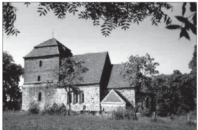
Ev. Kirche, Bellin

Im Dialog erarbeitete sich die Gruppe auch die historischen und baugeschichtlichen Besonderheiten. Interessant bei der Grundrissarbeit war der Vergleich mit den anderen Kirchen