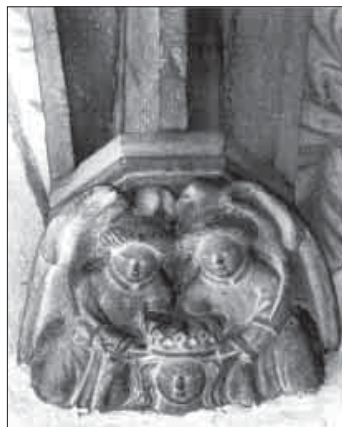
Marienkrönung (15. Jh.), Kloster Wennigsen

Besonders die Frage, ob es Engel überhaupt gibt, wird meiner Erfahrung nach sehr erregt von den Schülern diskutiert. Interessanterweise argumentieren die Kinder, die die Existenz von Engeln vertreten, vor allem mit ihrer Erfahrung (besonders mit Schutzengeln); diejenigen dagegen, die die Existenz bestreiten, haben kaum Argumente (haben sie die Ansicht älterer Geschwister oder von Erwachsenen übernommen, ohne sich darüber eigene Gedanken zu machen?).