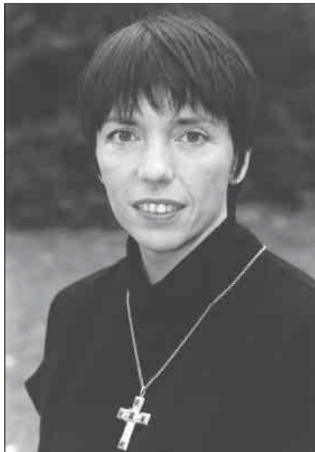
Landesbischöfin Dr. Margot Käßmann, Schirmherrin des Verbandes