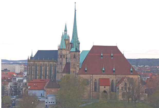
Blick auf den Erfurter Domberg, Foto: A. Scheinemann 2026