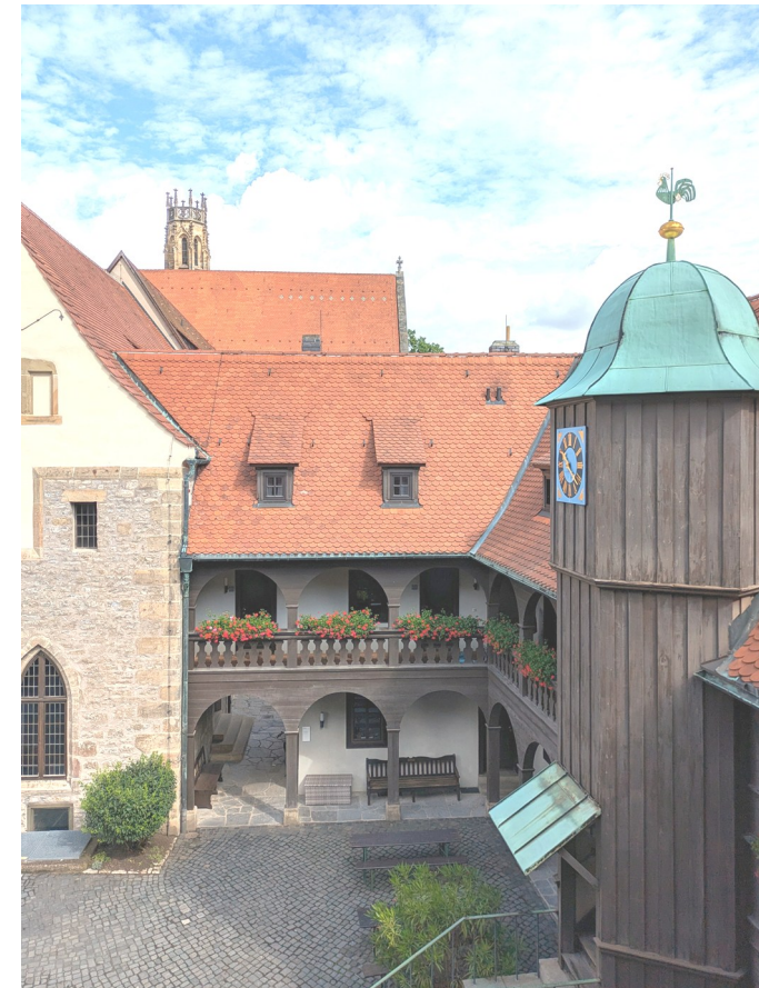
Hof des Augustinerklosters